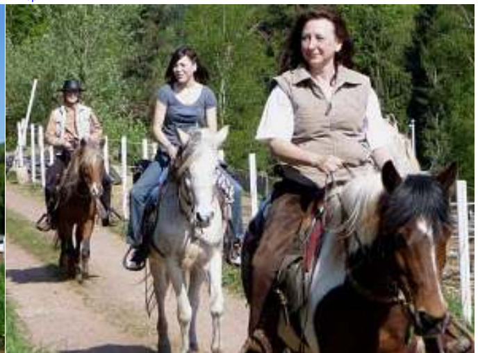
Aufbruch zu viert (plus 1 Fahrradfahrer - wir lieben Fahrräder)