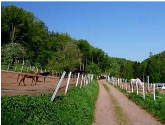
Koppeln vom Schönbachhof