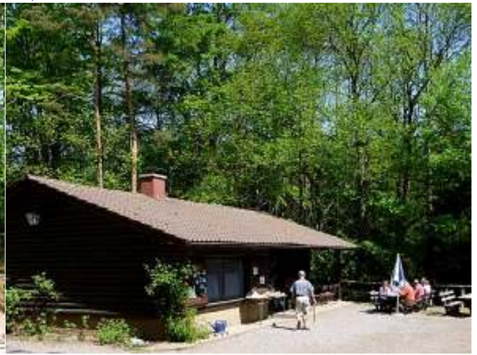
Die Wasgauhütte, auch Schwanheimer Hütte