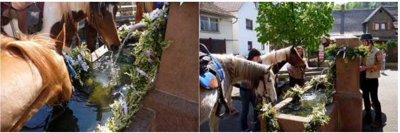
Tränke vor der Kirche in Schwanheim