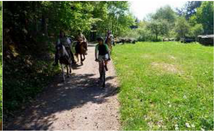
kurz vor dem Ort Darstein